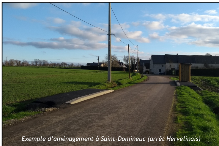
Exemple d'aménagement à Saint-Domineuc (arrêt Hervelinais)